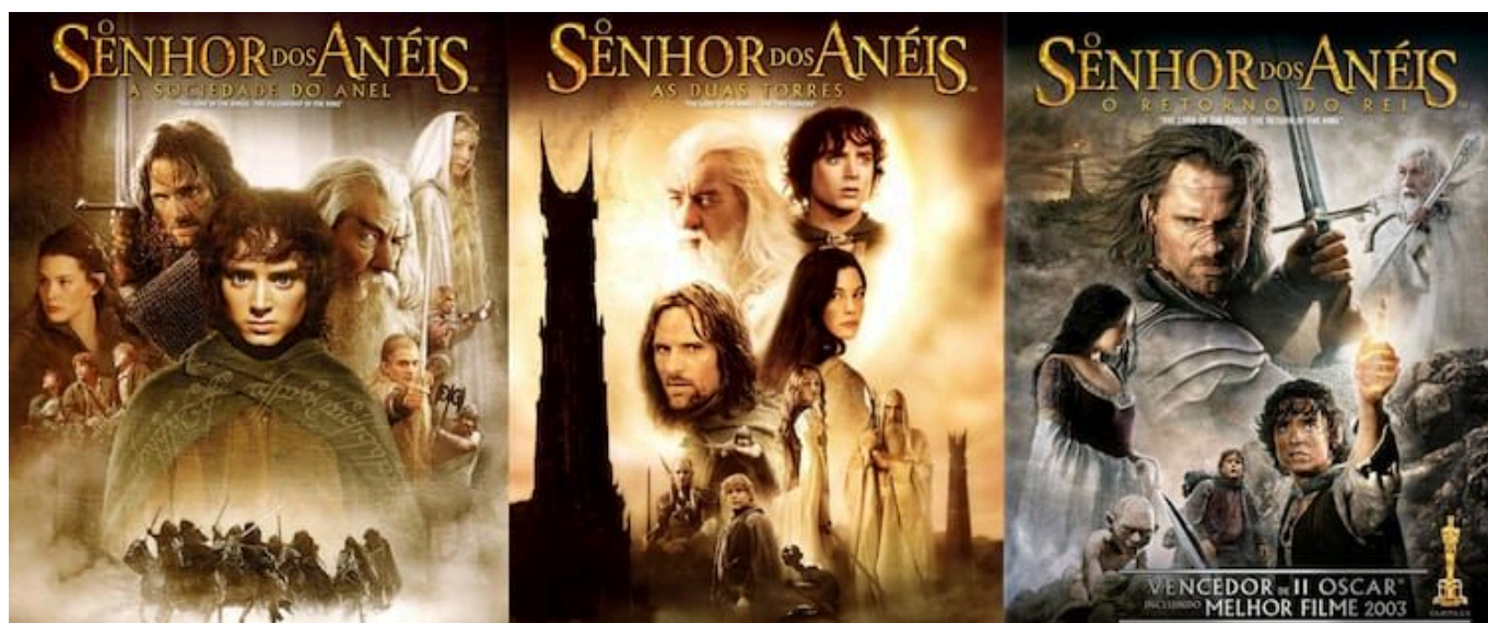
Livros da saga senhor dos anéis

No final da Primeira Era da Terra Média, Sauron sobreviveu à derrota catastrófica e ao exílio de seu mestre, a figura fundamental do mal, Morgoth e, durante a Segunda Era, Sauron planejou ganhar o domínio sobre a Terra Média.