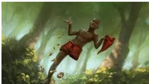
Dia do Saci - 31 de outubro

O saci é uma figura mitológica brasileira, presente no nosso folclore, representado por um menino travesso de uma perna só.