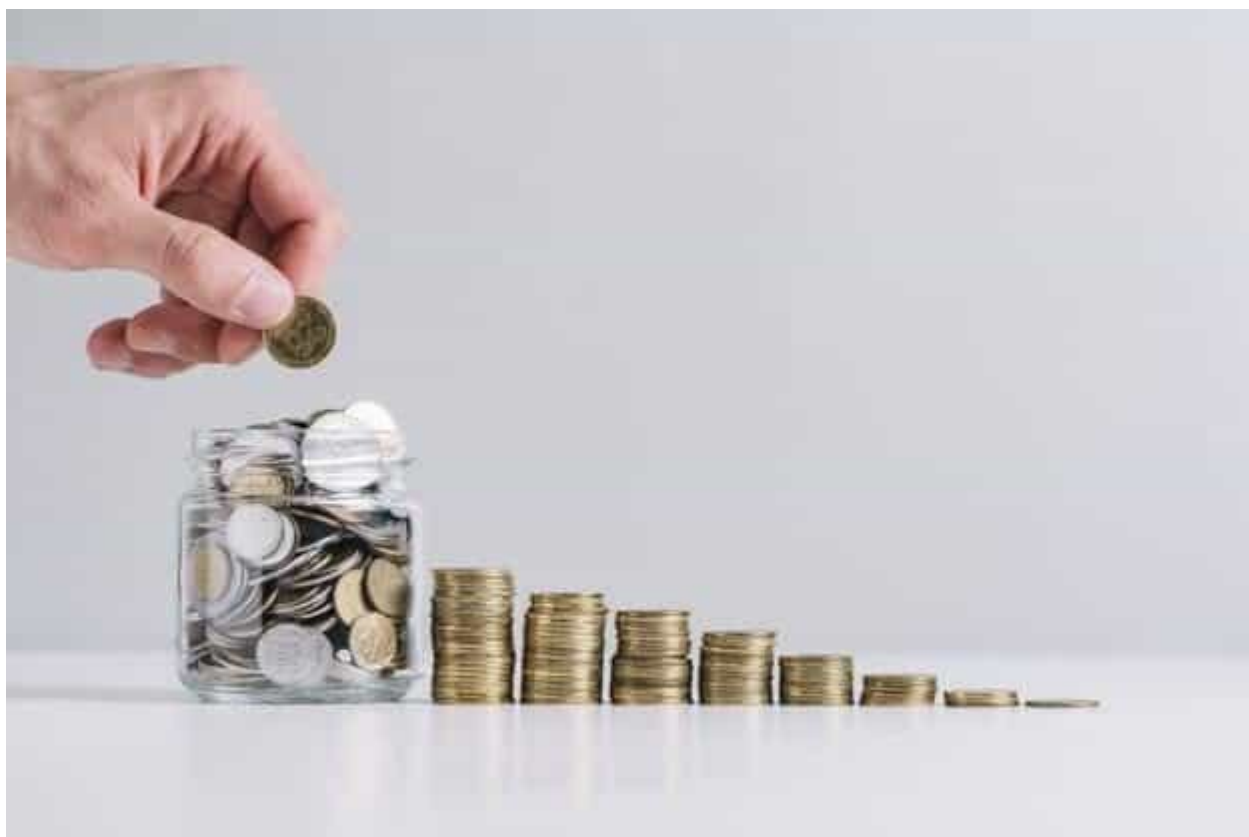
Dia Mundial da Poupança - 31 de outubro

A data visa conscientizar as pessoas sobre a importância de poupar.